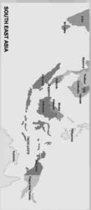
SOUTH EAST ASIA