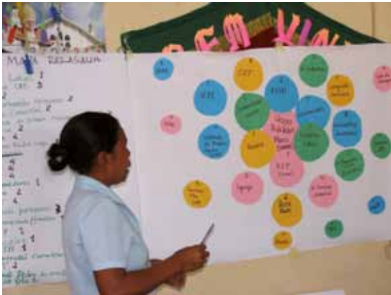
HAMOR nia Mapa Relasaun Sosial., Ermera