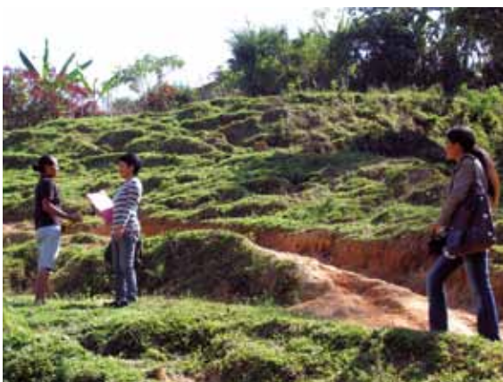
Aida ho Carmenesa halao survey, Ermera