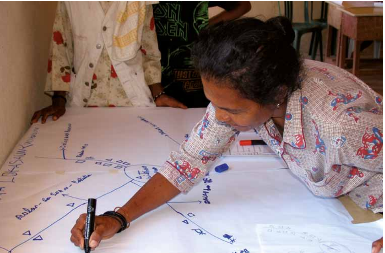
Alcina halo Mapa Lokasaun, Venilale