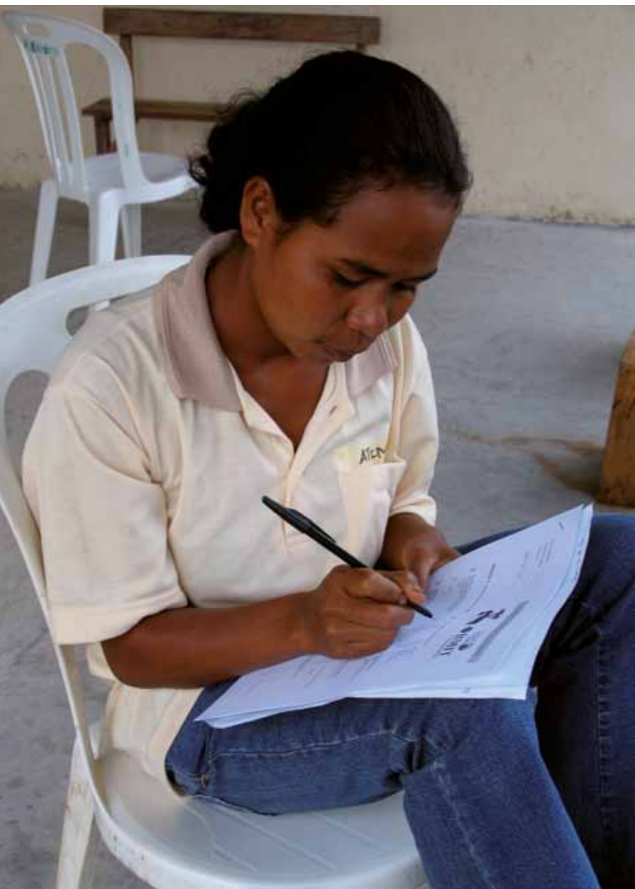
Staf CHT prene survey, Ermera