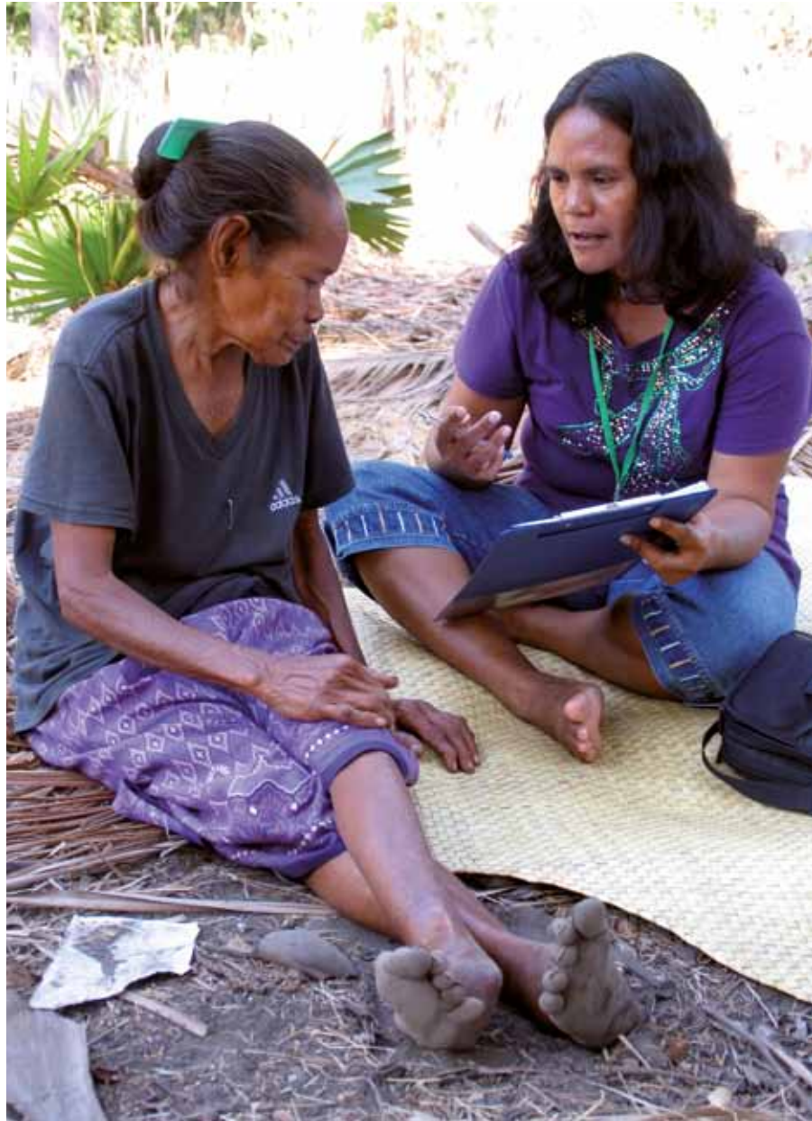
Eida halao survey ho ferik ne'e iha suco Beloi, Atauro