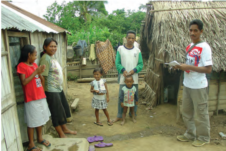
Empregadu lokál ida hosi ONE hasoru membru komunidade Porlamano sira hodi hato'o informasaun kona-ba projetu peskiza. Porlamano, Tutuala, Feveireiru 2010.

Tantu entrevista semi-estruturadu badak no naruk hala'o ba totál partisipante peskiza nian 19 (na'in-sia iha Ra'ano no na'in-sanulu iha Porlamano). Entrevista sira-ne'e fó oportunidade ba komunidade nia membru sira atu ko'alia ba naruk kona-ba tema oioin ho relasaun ba sira-nia esperiênsia no hanoin kona-ba introdusaun ba teknolojia foun sira. Peskiza nia partisipante sira ne'ebé envolve an iha entrevista semi-estruturadu inklui membru hosi Concern nia organizasaun maksahik lokál sira, komunidade nia ulun-na'in sira, animadór voluntáriu sira, no mós ema sira hosi umakain benefisiáriu no umakain sira ne'ebé la envolve an iha projetu.