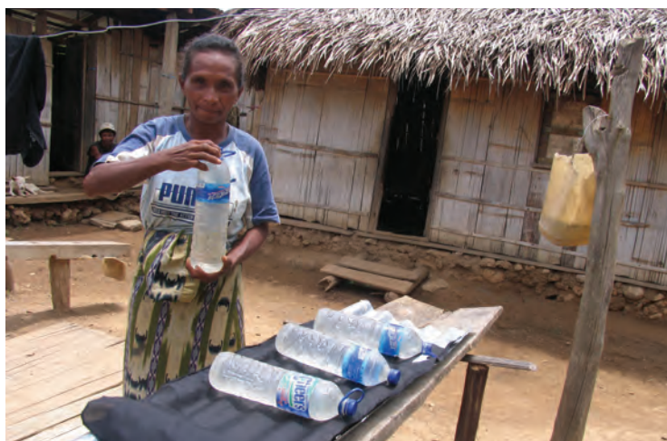
Feto ida hatudu oinsá nia tau botir nakonu ho bee iha hena metan leten hodi purifika bee atu seguru ba hemu, Porlamano, Feveiru 2010.