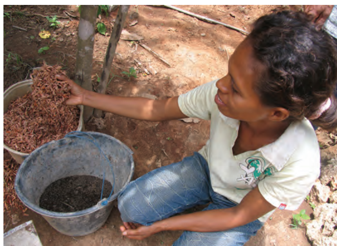
Feto ida hatudu materiál balu ne'ebé nia hili no uza hodi prodús adubu orgániku ba ninia to'os, Porlamano, Feveiru 2010.

Agrikultór sira hosi Ra'ano no Porlamano uza daudaun adubu orgániku nu'udar alternativa ida ba sosa adubu kímiku ka métodu tradisionál liu ne'ebé uza karau-teen. Adubu orgániku halo tomak ho materiál naturál, hotu-hotu ne'ebé disponivel iha área lokál. Prosesu produsaun nian envolve hili materiál sira hanesan balada nia teen, ai-tahan maran no ai-han ho hemu restu. Ke'e tiha rai-kuak ida (bele mós uza balde boot ida hanesan alternativa) hodi tau materiál sira-ne'e iha laran, depois taka tiha hodi husik durante maizumenus semana rua. Ho tempu kakahur ne'e dodok tiha no nakfila ba fertilizante ho kualidade di'ak ne'ebé la kusta doit ida ba umakain.