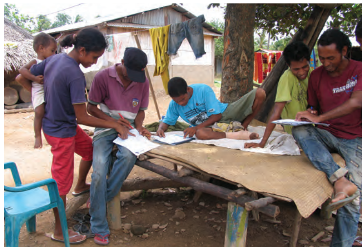
Komunidade nia membru sira tuur hamutuk hodi prenxe kestionáriu, aldeia Porlamano, Tutuala, Feveireiru 2010.

Tantu entrevista semi-estruturadu badak no naruk hala'o ba totál partisipante peskiza nian 19 (na'in-sia iha Ra'ano no na'in-sanulu iha Porlamano). Entrevista sira-ne'e fó oportunidade ba komunidade nia membru sira atu ko'alia ba naruk kona-ba tema oioin ho relasaun ba sira-nia esperiênsia no hanoin kona-ba introdusaun ba teknolojia foun sira. Peskiza nia partisipante sira ne'ebé envolve an iha entrevista semi-estruturadu inklui membru hosi Concern nia organizasaun maksahik lokál sira, komunidade nia ulun-na'in sira, animadór voluntáriu sira, no mós ema sira hosi umakain benefisiáriu no umakain sira ne'ebé la envolve an iha projetu.