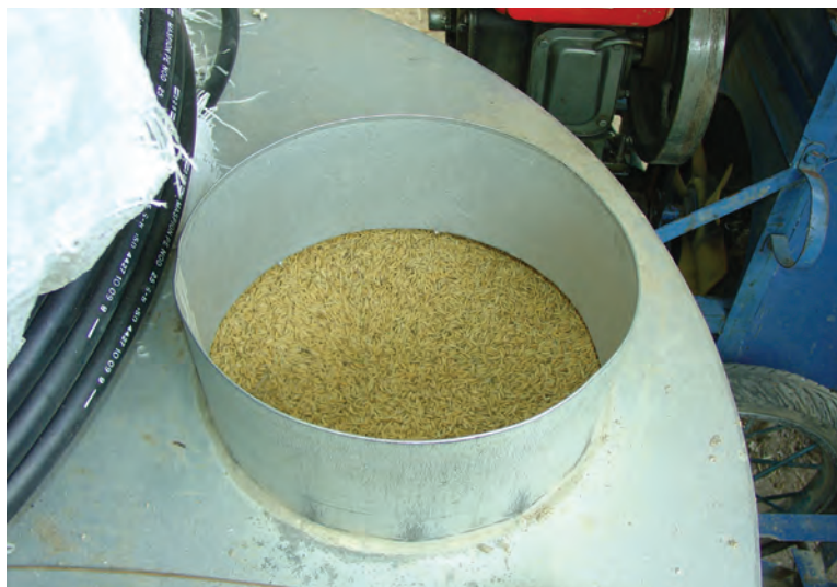
Silo ida ne'ebé uza hodi rai hare, Ra'ano, 2010.