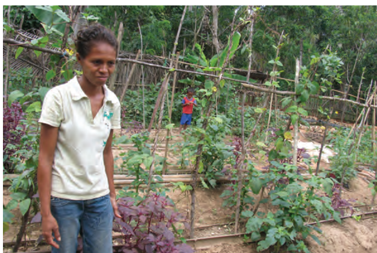
To'os ida-ne'e hetan benefísiu hosi uza adubu hodi kuda modo orgániku, Porlamano, Feveiru 2010.